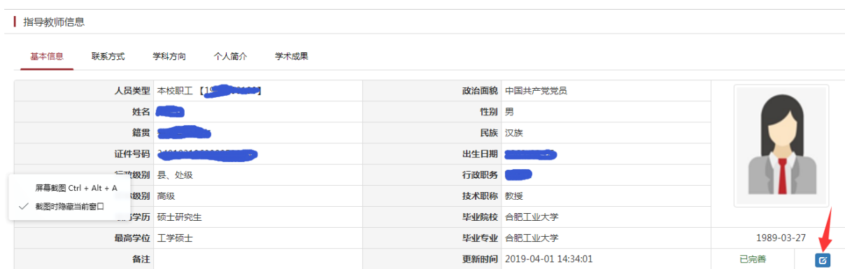
图四：填写完成后需要修改，按箭头处蓝色按钮