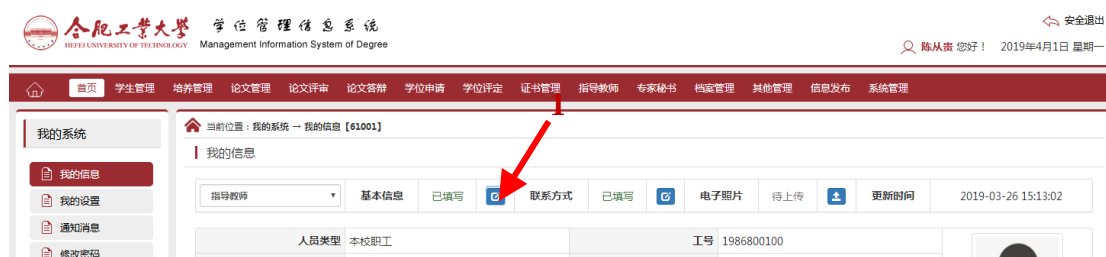
图三：完善个人信息从基本信息开始