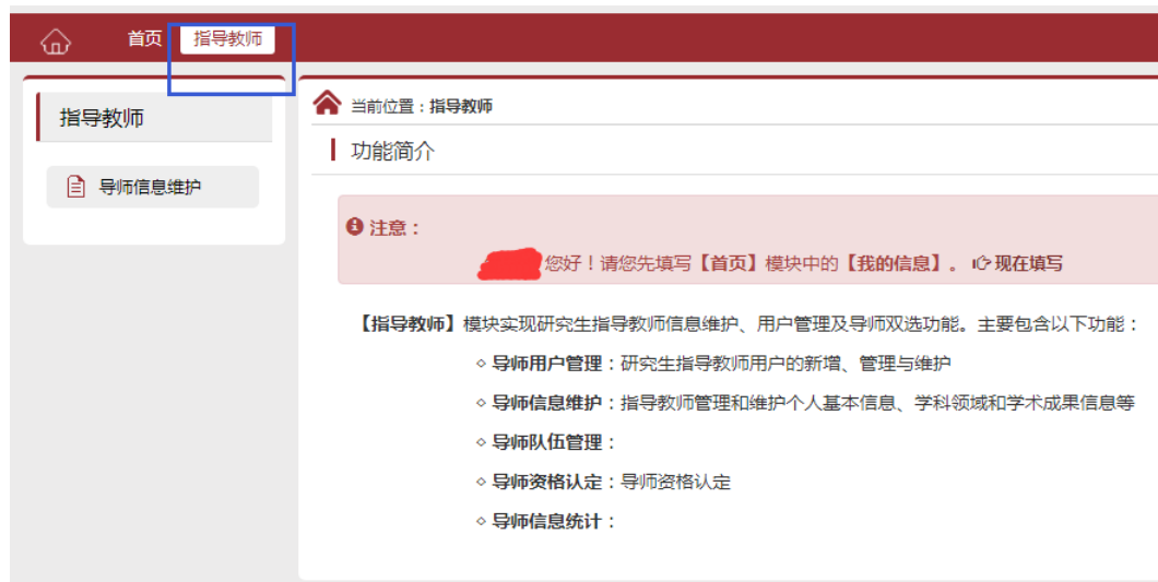
图五：指导教师信息维护开始界面