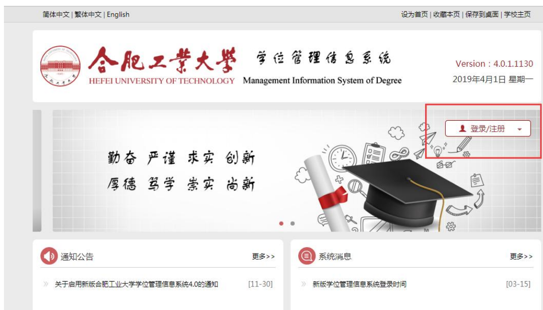
图一：系统登录界面

http://121.251.19.90/xwxt4/user.php?act=admin.ArchivesManagement.GraduatedStudentArch